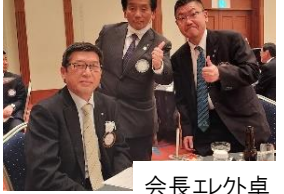
会長イレク卓 (右:内田会長イレク)