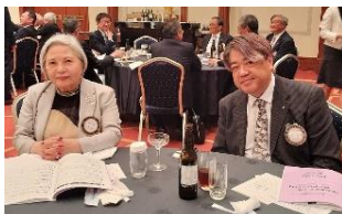
社会奉仕卓(右:星委員長)