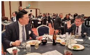
親睦卓(右:菊地副委員長)