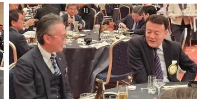
入会3年未満卓(左:芳賀会員)