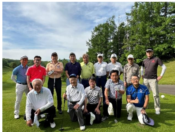
西ロータリークラブとの合同コンペ 2023年6月16日(金) 於：札幌南ゴルフクラブ駒丘コース・07:37 スタート

※1 札幌市内合同事務所取りまとめの予定です。 ※2 各クラブの MU につきましてはクラブにより異なりますので、事前にご確認をお願いいたします。