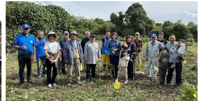
旧豊平川: 地植え・BB 定植 300 個