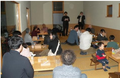
例会(何人かはそば打ち中)

1年に1度の楽しい「秋のそば打ち例会」がやってきました。太さマチマチ、でも美味し〜い！