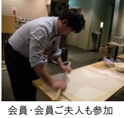
会員・会員ご夫人も参加